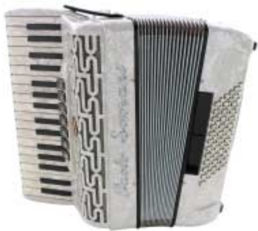
Junior II LA