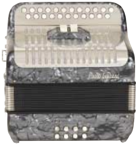
Jubilee Grey Box