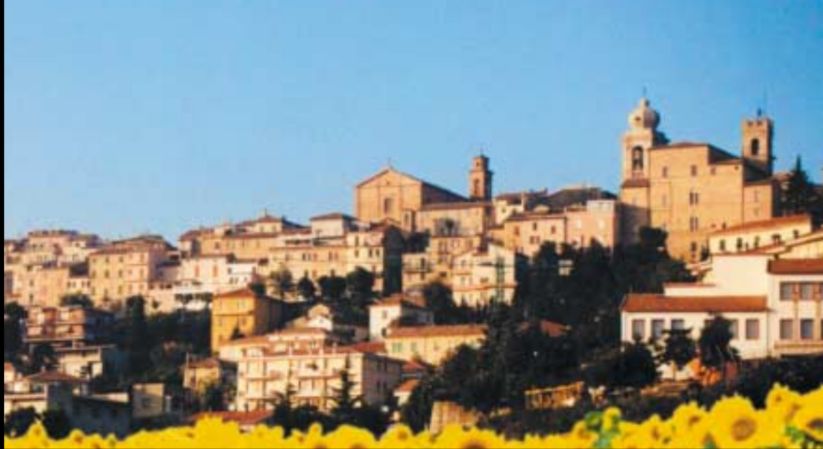
| Panorama di Castelfidardo | | A view of Castelfidardo |