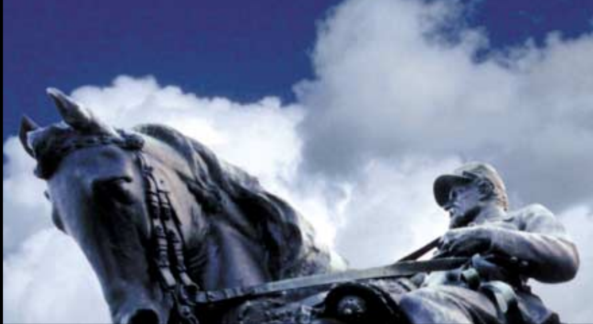
| Monumento nazionale della battaglia di Castelfidardo | | National monument of the battle of Castelfidardo |