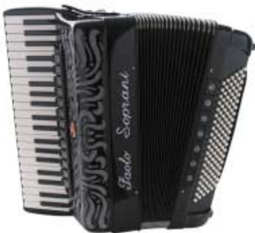
Super Paolo II