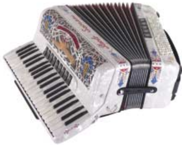
Super Paolo IF