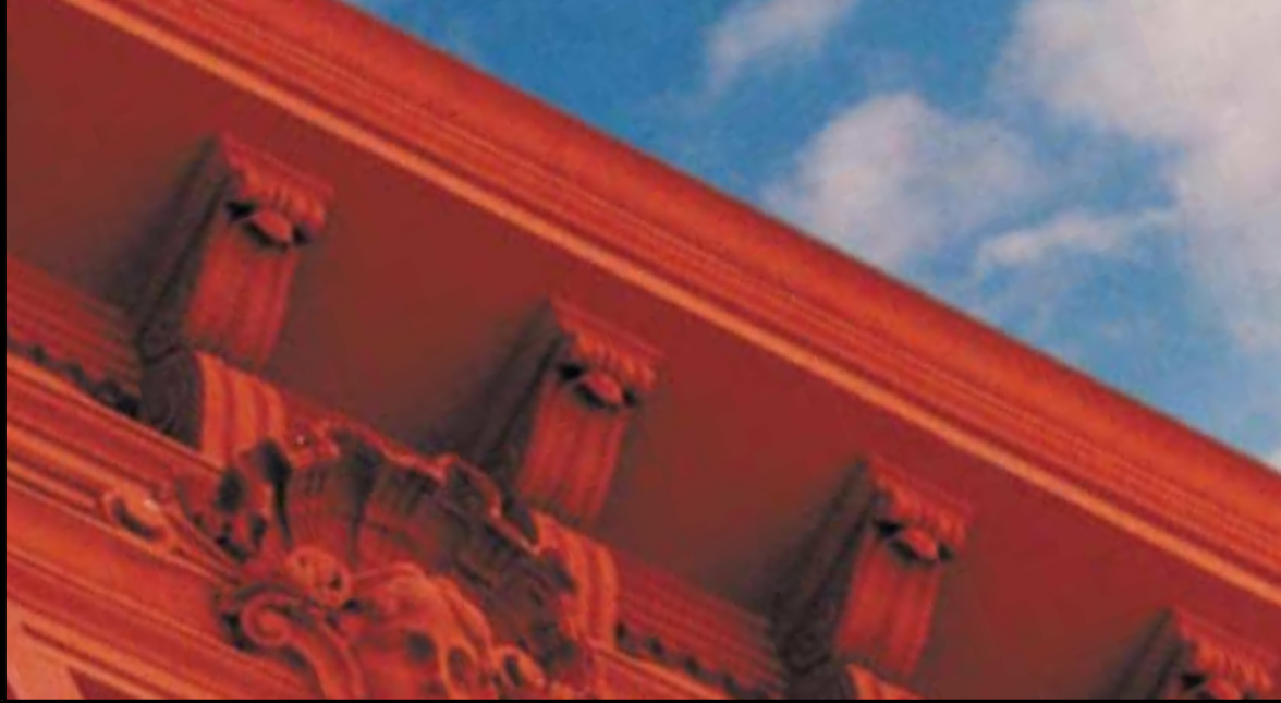
| Un particolare di Palazzo Soprani | | A detail of Palazzo Soprani |