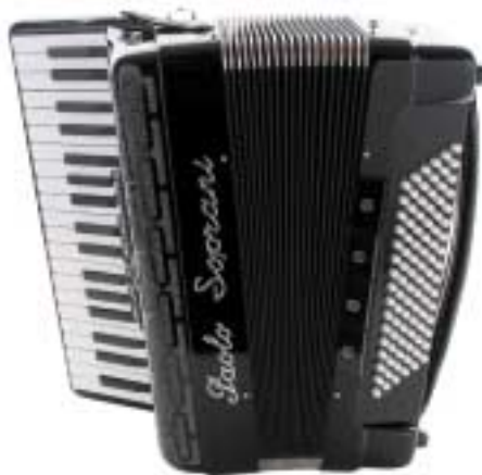
Professional I School Line