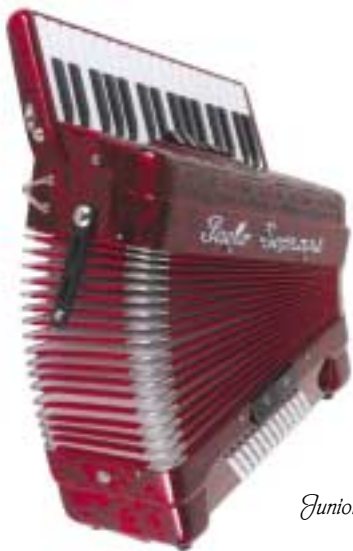
Junior II School Line